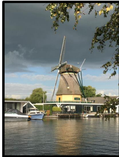
Lex, met uitzicht op de molen....

Met twee delen minder vis ik stug door. Het ging goed. Ik ving prachtige voorns, ook kleinere, maar toch maats. De grondels en andere torretjes bleven vooral weg. Gunstig!