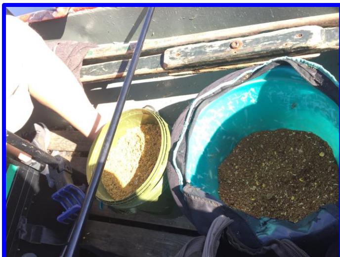
De voeremmers nog gevuld.

René zat aanvankelijk nog wat te 'sleutelen' aan dobbers en gewichtjes, maar uiteindelijk had ook hij de gang er in. Beiden hadden we ons eigen voer. Het leek er op dat het voer van René sneller vis lokte, maar ook kleinere. Zijn dobber, trouwens ook de mijne, stonden af en toe gewoon te dansen. De grotere vis ving hij wat later, toen zijn stek meer opgebouwd was. Ik voerde minder balletjes en wat meer casters en maden.