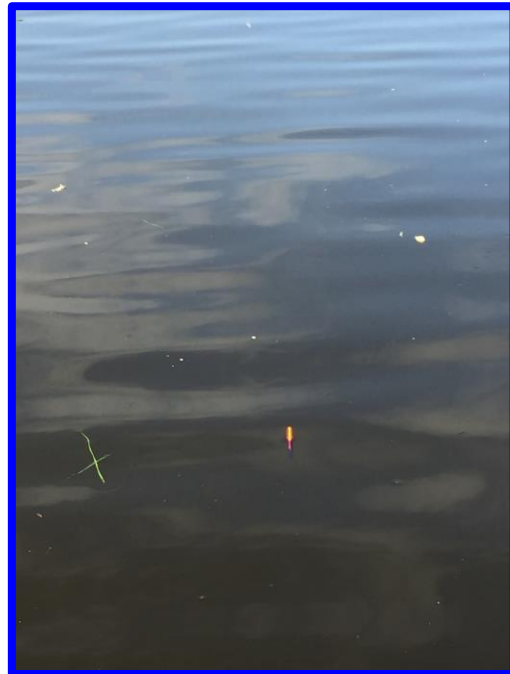
In opperste concentratie.....