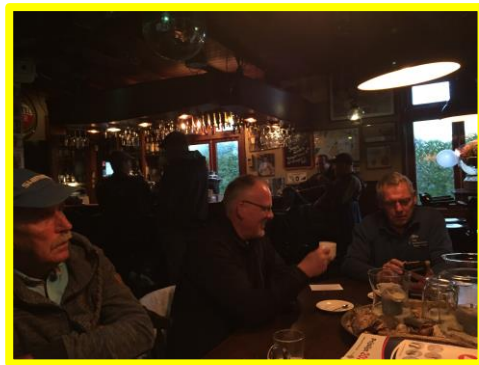
Voor vertrek, eerst koffie en voor een enkeling een Jägermeister...

Verkassen is niet mijn sterkste kant. Alles weer afsluiten, want ik stoot natuurlijk de madendoos om, of de voerbak. Tuigje oprollen of hengel 'heel' laten en goed vast houden, met alle risico's van dien.