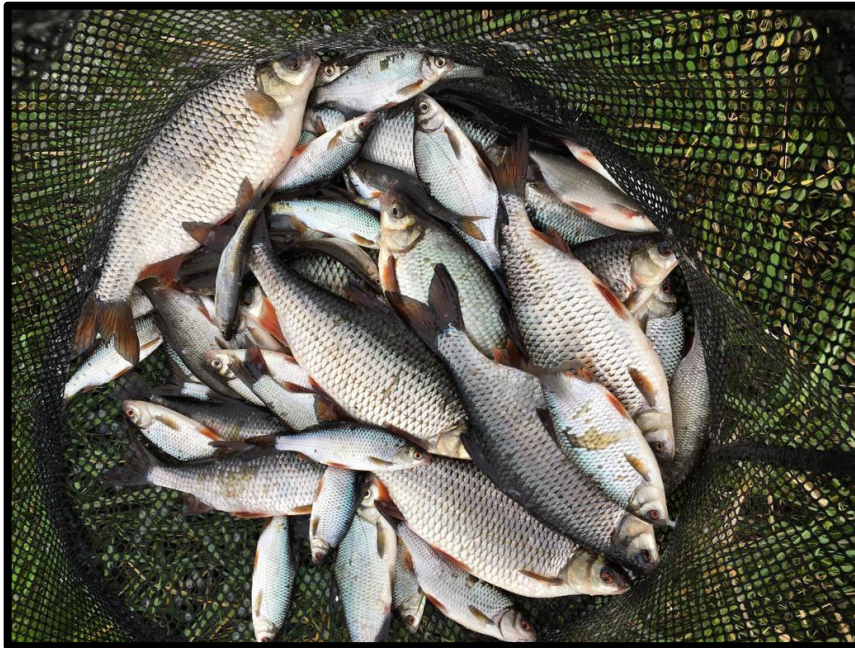
Zijn dit voorns, of zijn dit voorns?

Deze foto kreeg ik woensdag 13 april toegestuurd door Gerrit. Hij was in zijn nopjes, want had een topochtendje gehad bij de Bestevaer.