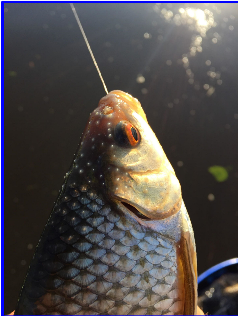
Voorn met paaipukkels

Zelf blijf ik op kort nog enkele prachtige voorns bij vangen. Wat een knapen zeg. Sommigen zitten onder de paaipukkels, ook wel paai-stopfels of paai-knobbels, en voelen ruw aan.