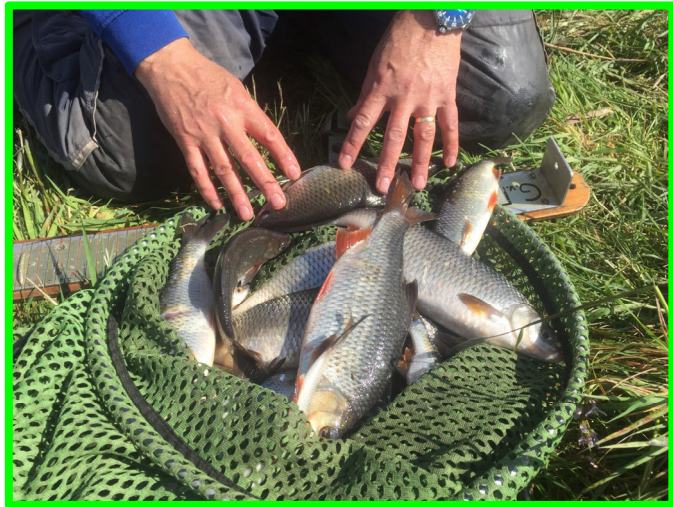
Flinke voorns zorgden voor spektakel!