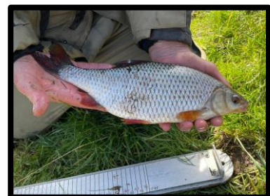
Maar liefst 41 cm.!

Gert verspeelde nog een enorme brasem. De vis 'beukte' zijn hengeltop verschillende keren het water in en liet zich niet scheppen! Uiteindelijk was zijn 10/100e lijn niet bestand tegen zoveel gewicht en geweld en koos het dier de enkele reis naar de diepte. Balen dus.