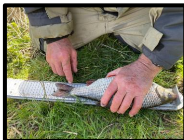
Wat een kanjer!