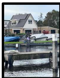
Lex aan de kant....