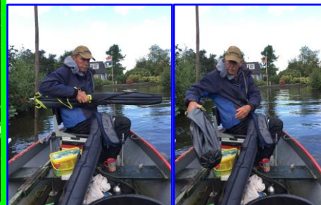
Pluutje uit, pluutje in....

Onze vangst was uiteindelijk echter niet al te best.