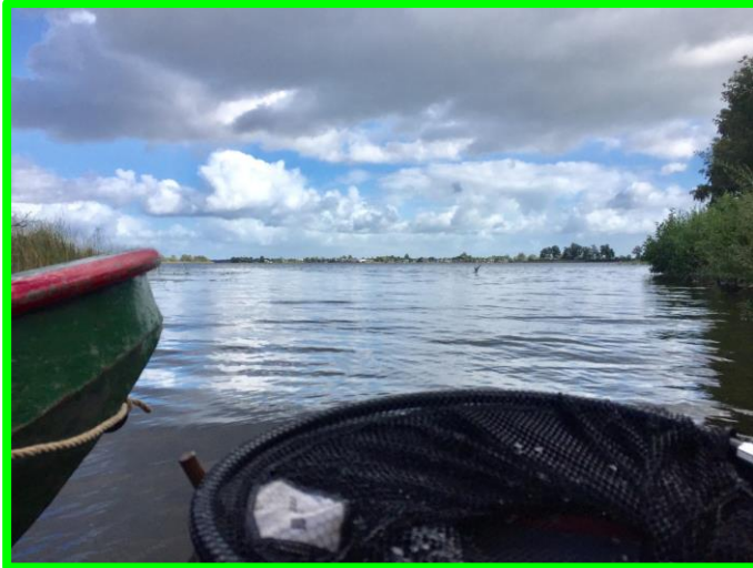
Hoe mooi wil je het hebben?!

Het weer was wisselend: paraplu op, paraplu in....zonnetje erbij, beetje wind, prachtige plek. Eigenlijk best acceptabel allemaal.