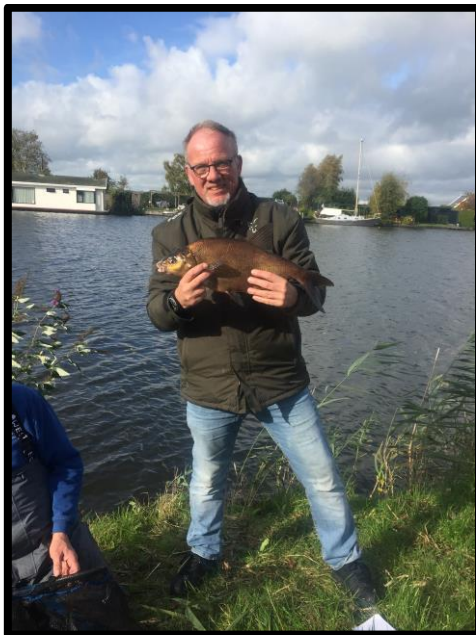
Hier doe je het voor!