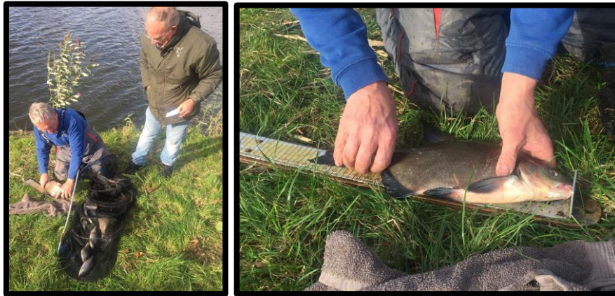
Nauwkeurig meten is precies weten!