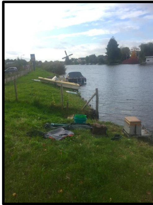
Het weerbeeld: droog, bewolkt, winderig.