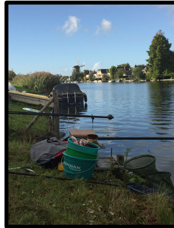
Een georganiseerde bende....

Eerst maar voeren op lang en vervolgens een klein beetje op kort. Dan de korte stok pakken en vooraan starten. Meteen een maatse voorn. Lekker! Vervolgens 2x grondel, niets.....,weer een grondel, een klein voortje,.... Ik hoor het bij Gerrit ondertussen regelmatig plonzen. Wat een rot geluid!