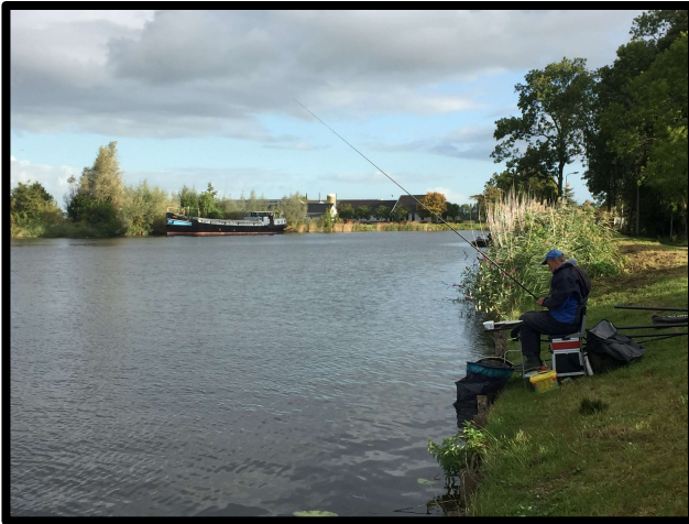
Volle concentratie voor prachtige voorns!

En ik ondertussen maar doorklussen: plateau, standaards, lange en korte stok, cuphengel, voerbakken, aasbakjes, 2x uitpeilen, enz., enz. Tegelijkertijd tikte de klok door en wist ik dat de tijd vóór tien bijna altijd de meeste vis opleverde. Tactiek: rustig blijven!