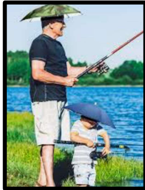
Geen plu, maar parasol.

Er zijn van die dagen die het vooraf bedachte plan verstieren. Vandaag was zo'n dag. Met bakken kwam het uit de hemel. Echt geen motorweer. Dan toch maar onder de plu met een hengel.