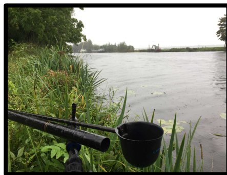
Cuphengel in de aanslag....