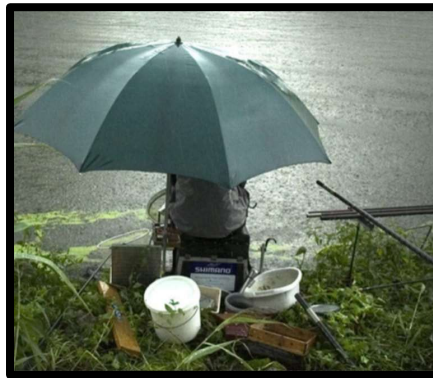
Dit is met een hengel onder de plu.

Verzamelen onder het afdak bij 'de Generaal' in Baarn. Er zouden vandaag maar 7 deelnemers zijn. Begrijpelijk ook.