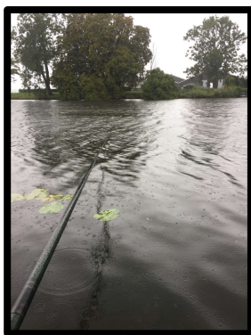
Met de 9,5m-stok....

Ik wissel lang en kort af met dezelfde hengel. Wel steeds de dobber verschuiven dus. Een aantal topsets was handig geweest vandaag.