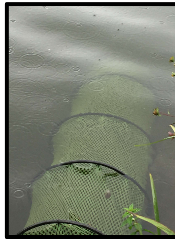
Er is nog veel ruimte in het leefnet.

Helaas is het voor mij geen top sessie geworden met 23 stuks. Toch wel wat vis verspeeld en vooral veel te veel 'torren', ondanks de stevigere beazing.