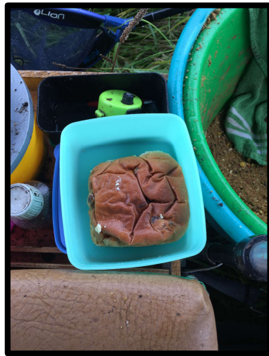
Heerlijk zo'n krentenbolletje.

Gauw dan maar een krentenbolletje en een kop warme thee. Simpel, maar zo heerlijk!