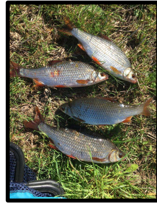
Gerrit had prachtig weer en ving de mooiste vissen, ruim 80 stuks!